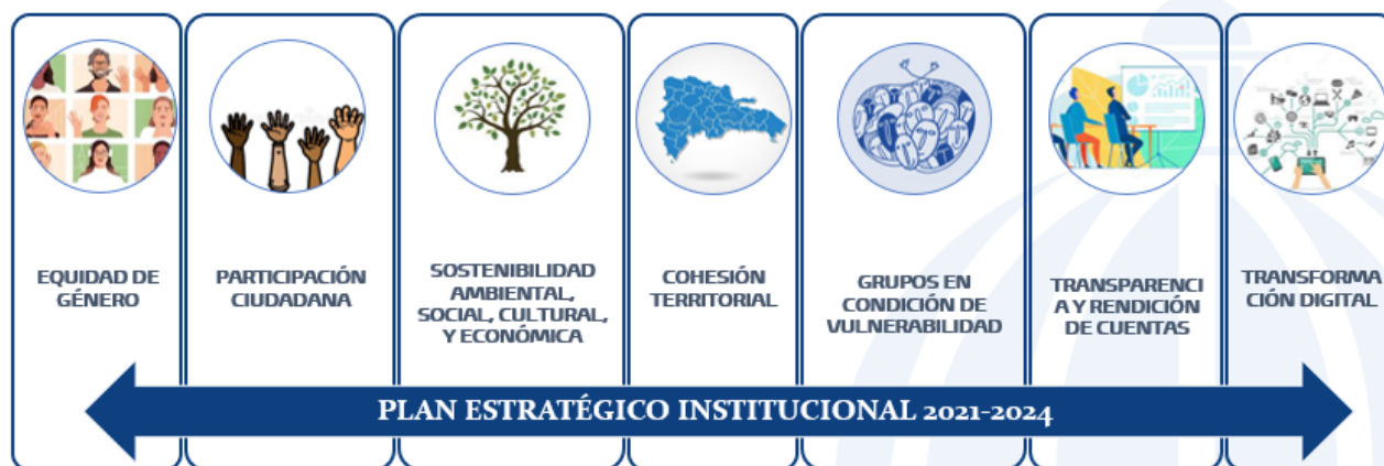
GRÁFICO 4 – EJES TRANSVERSALES

El MEPyD como entidad rectora del Sistema Nacional de Planificación e Inversión Pública, además, facilita la elaboración de metodologías para incorporar las políticas transversales en sus respectivos planes, programas y proyectos.